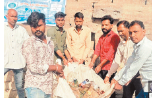
हरिभूमि न्यूज़ ►► माचलपुर