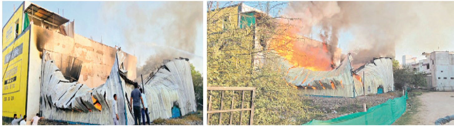
हरिभूमि न्यूज़ ►► जीरापुर

नगर के विजया कावेंट स्कूल रोड के पास नगर परिषद अध्यक्ष प्रतिनिधि के मकान के पीछे स्थित शारदा फर्नीचर के गोदाम में करीबन पांच बजे अचानक भीषण आग लगने से हड़कंप मच गया।